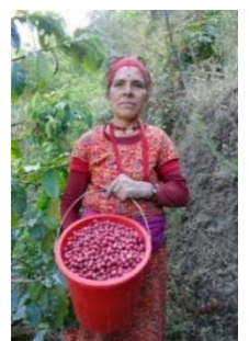
生産者の農家の方の一人